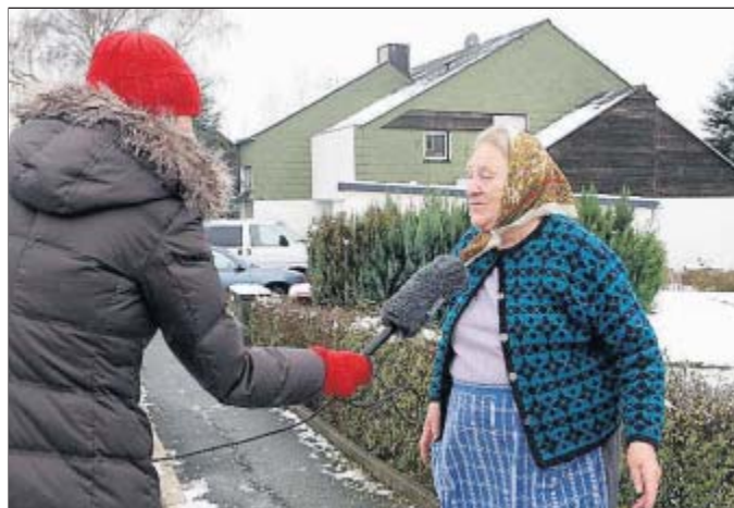
Gefragte Interview-Partnerin: Eine Frau aus der Nachbarschaft