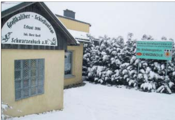
Die Anlage der Schwarzenbacher Schießsport-Union. Die Mitglieder gehen überwiegend mit scharfem Großkaliber um.