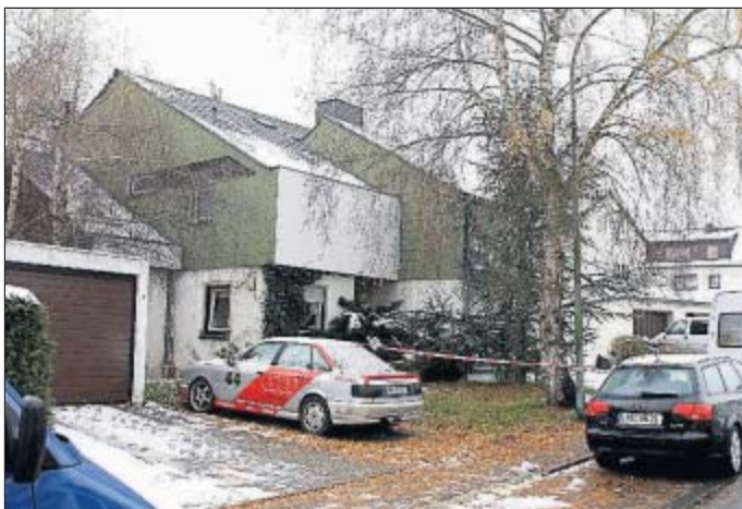
Das grüne Haus rechts – der Tatort in der Nailaer Hubertusstraße